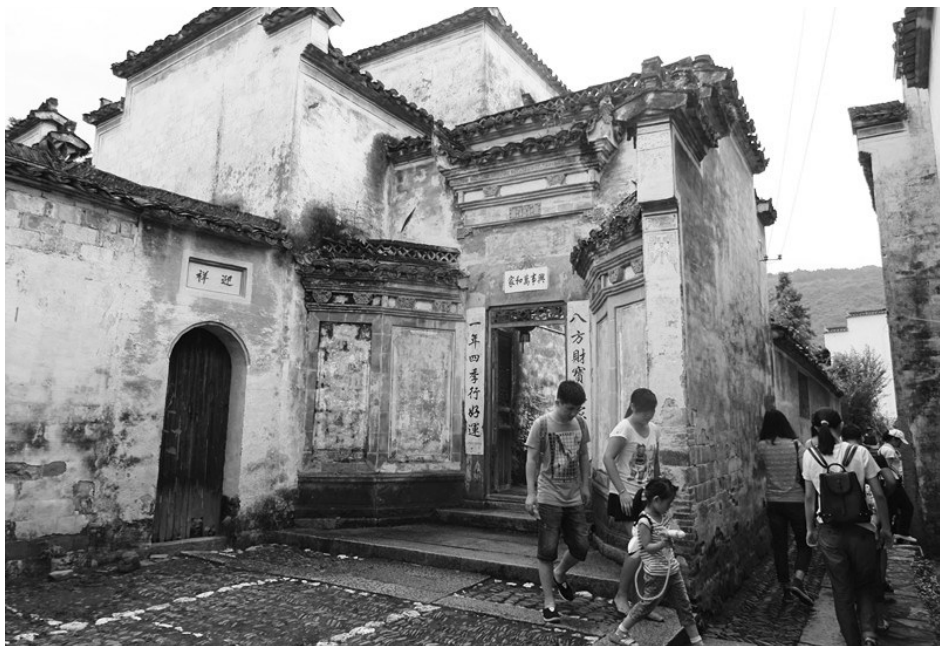
今年暑期以来，黟县关麓传统村落迎来旅游旺季，以家庭亲子游居多。图为8月15日，一些家长带着孩子畅游关麓。

市旅游质监网在线投诉平台进行投诉。屯溪区旅游质监所就此事进行调查，得知牛女士是通过美团团购网站预订8月5日由黄山某旅行社代售的《徽韵》演出门票，两张门票共计280元。由于时间较仓促，代售门票的旅行社没有及时获取《徽韵》演出调整信息。经协调，旅行社将购票款280元予以全额退还，牛女士表示满意。