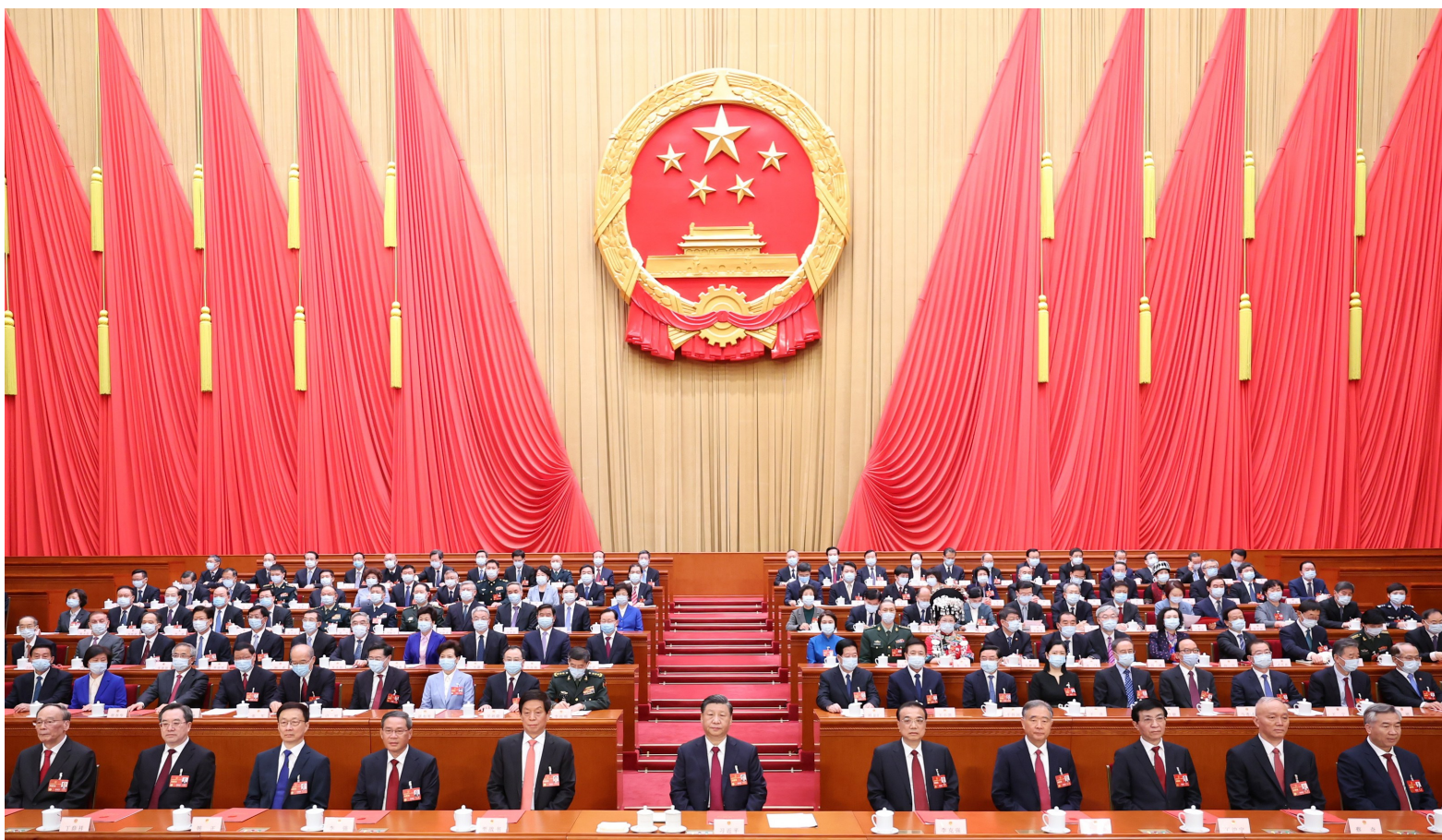
3月13日,第十四届全国人民代表大会第一次会议在北京人民大会堂闭幕。中共中央总书记、国家主席、中央军委主席习近平发表重要讲话。